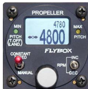
Propellerregler Flybox PR1-P

Die Bedienung erfolgt über den Propellerregler „Flybox PR1-P“ im Cockpit. Der Propellerregler steuert seinerseits den elektrischen Spindelantrieb, der für eine stufenlose Verstellung des Blattwinkels sorgt.